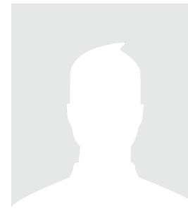
Rafael Lyra Monte Coordenador Estadual do Rio Grande do Norte